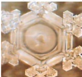
‘Thank you’ आभारं अर्पयामास

(typewritten words were taped onto glass bottles overnight)