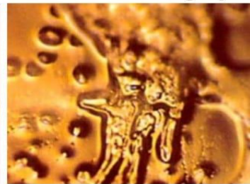
‘You make me sick, I will kill you’ आपसंभारं अर्पयामास